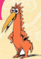
Illustration: Douan Perrelec (2012)